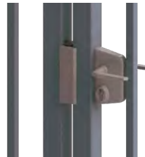
SERRURE DE GRILLE